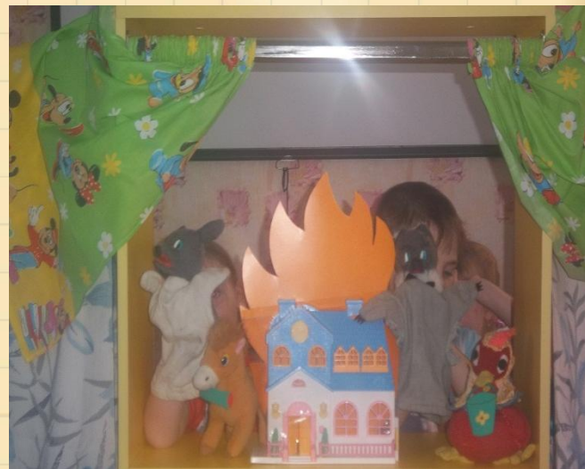
Технология игровой обучающей ситуации