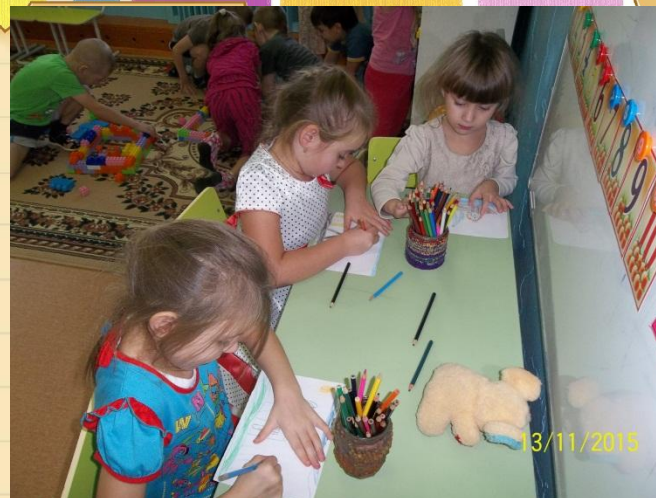
Арт - технология