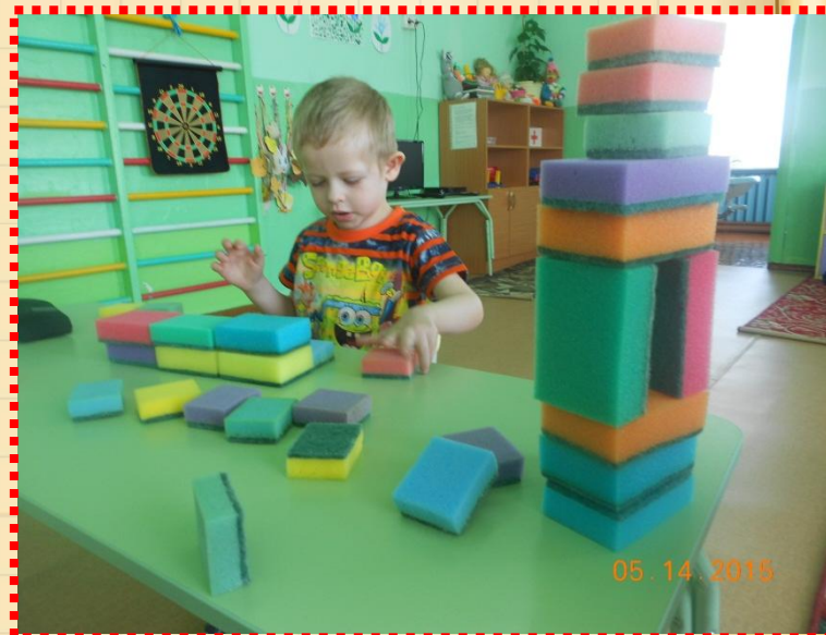
Технология игровой обучающей ситуации