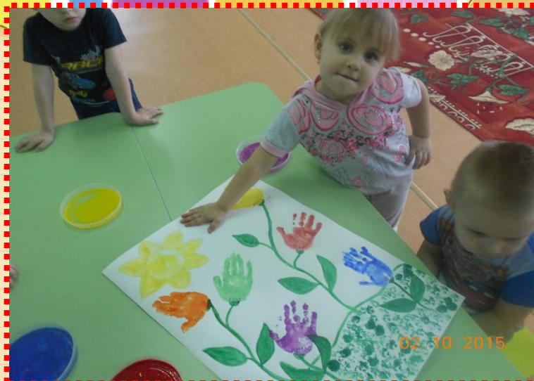
Арт - технология